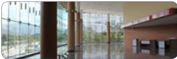
컨벤션홀 로비 전경